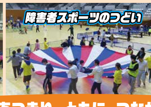
障害者スポーツのつどい