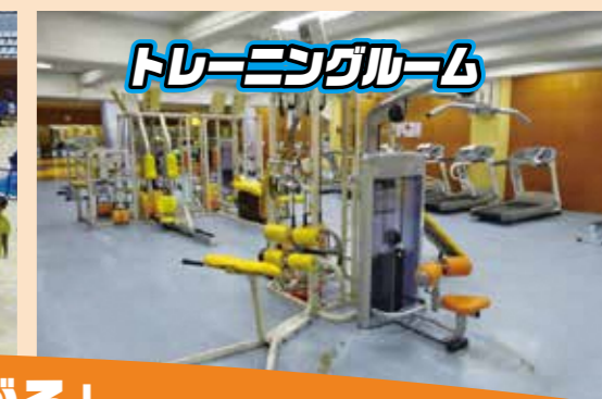
トレーニングルーム