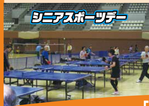
シニアスポーツデー