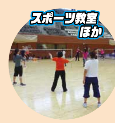
スポーツ教室 ほか