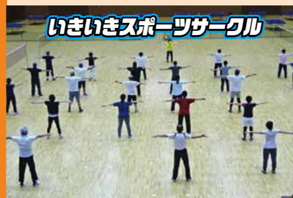
いきいきスポーツサークル