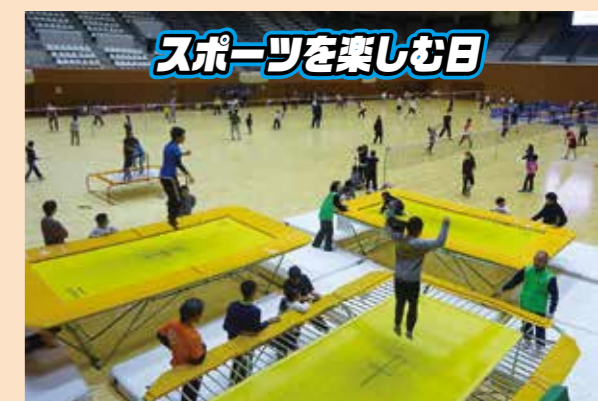
スポーツを楽しむ日